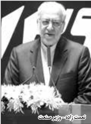
نعمت زاده - وزیر صنعت