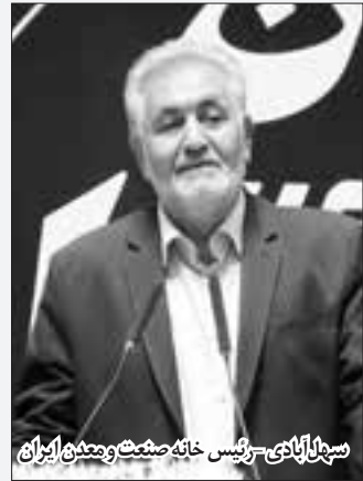
سپه‌آبادی - رئیس خانه صنعت و معدن ایران

پورمند افزود: ۹۰ درصد کل ثروت دنیا به ۳۰ کشور تعلق دارد و در این میان، کشور ما با یک درصد جمعیت جهان یک دهم ثروت جهانی را در اختیار دارد پس در کشورمان ثروت آفرین نبوده‌ایم.