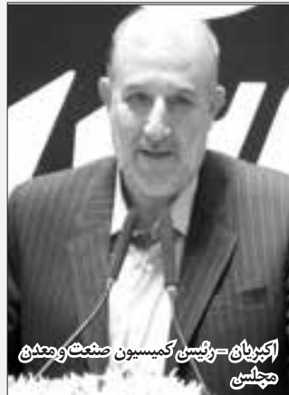
اکبریان - رئیس کمیسیون صنعت و معدن مجلس