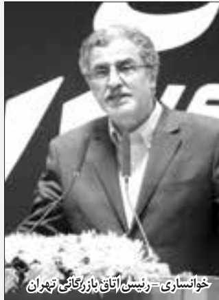
خوانساری - رئیس اتاق بازرگانی تهران