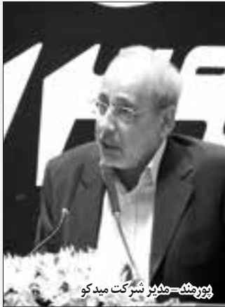
پورنسر - مدیر شرکت میدکو